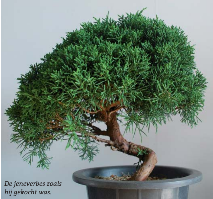
De jeneverbes zoals hij gekocht was.

De vakantie zit er weer op. Ik hoop dat iedereen een fijne vakantie heeft gehad en alle boompjes het hebben overleefd.