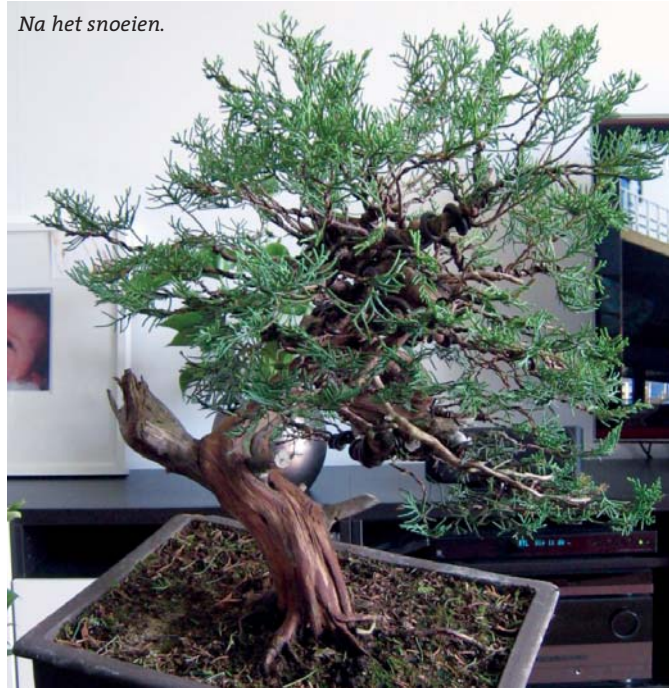
Na het snoeien.