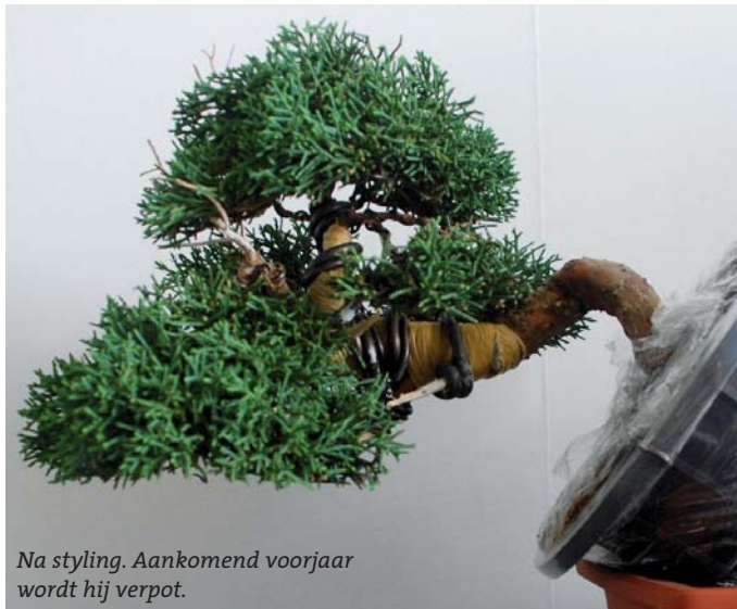
Na styling. Aankomend voorjaar wordt hij verpot.

om de komende tijd zoveel mogelijk te gaan bedraden. Dat heb ik gedaan door de afgelopen periode twee bomen te bedraden en te