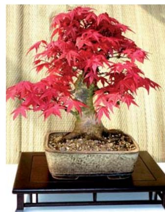
Acer Deshoyo, 20 jr, 22 cm