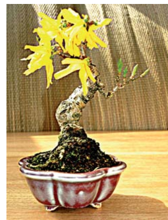
Forsythia 14 jr, 13 cm