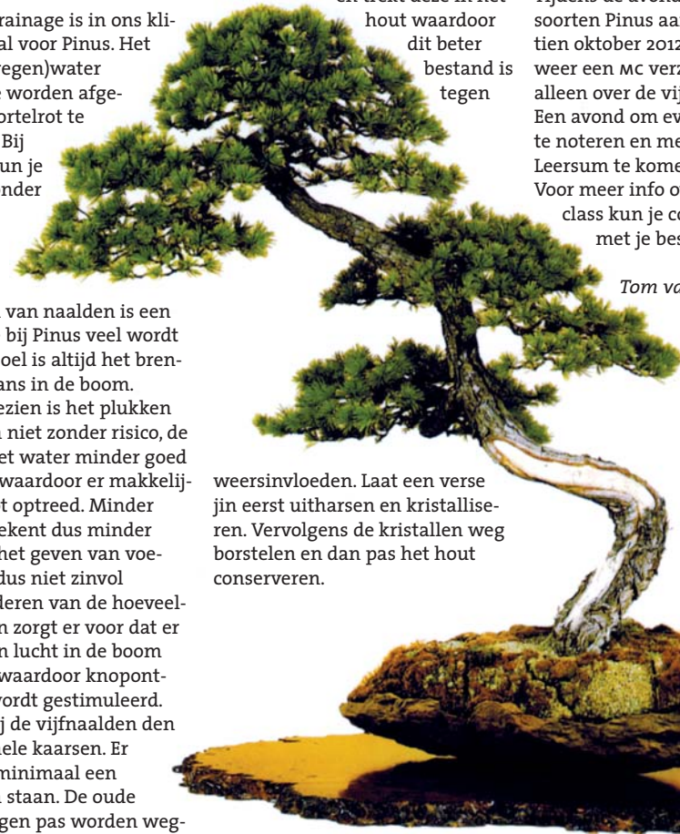
Tom van Wanum

en trekt deze in het hout waardoor dit beter bestand is tegen