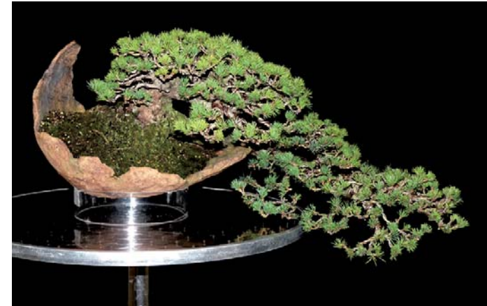
Een prachtige Pinus parviflora door een van de leden naar de bijeenkomst meegenomen.