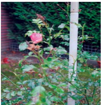
En deze roos. Is dat een late uit 2011 of een voorloper uit 2012?