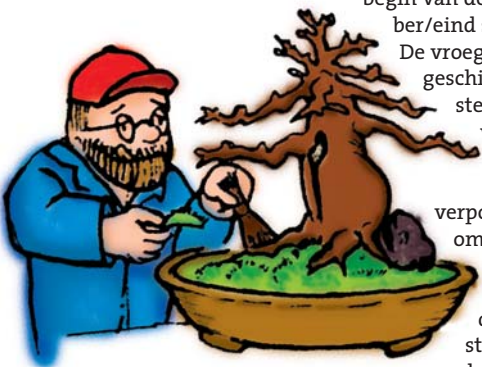
Positioneer de boom zo dat de nebari (wortelvoet) het beste uitkomt. Mos op de grond ziet er goed uit en voorkomt uitdrogen.

De vroege lente is het meest geschikt omdat dan de sterkste hergroei plaatsvindt. Laat lente tot midden zomer is een slechte tijd voor verpotten en wortelsnoei, omdat de boom dan in volle groei is en de onderbreking van de vochttoevoer ernstige schade aan de zachte nieuwe uitlopers toebrengt. In geval van noodzaak tot verpotten in deze tijd kan volledige ontbladering en het terug snoeien van takken de overlevingskans vergroten.