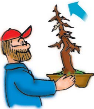
Laat de boom wat naar voren overhellen.