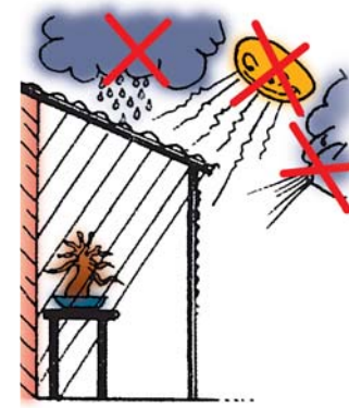
Geef de boom na het verpotten minstens twee weken bescherming.