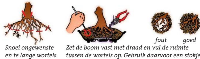
Snoei ongewenste en te lange wortels.

Een pas verpotte boom, die wortelsnoei heeft ondergaan, is te vergelijken met een stek, totdat er zich weer nieuwe haarwortels